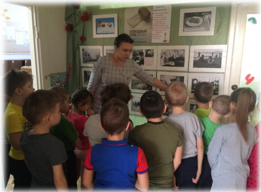
Фото к проекту "Блокадный Ленинград".